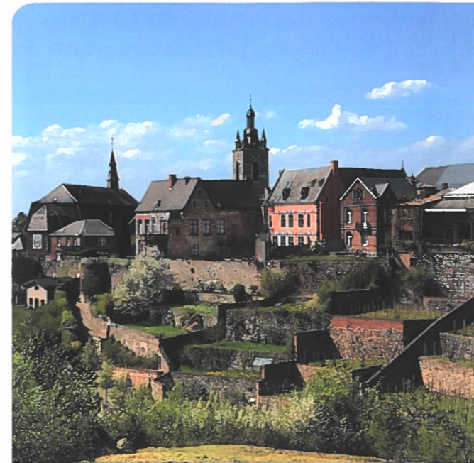
Jardins suspendus de Thuin