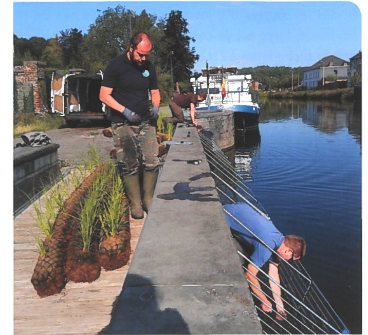
Pose de paniers végétalisés le long de la Sambre navigable à hauteur de Thuin