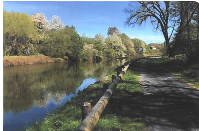
Chemin de halage le long de la Sambre à hauteur d'Erquennes

Au-delà de l'enjeu lié au maintien et à la restauration de la biodiversité, le projet TVBuONAIR a permis d'inscrire le territoire dans une ambition globale de requalification de son image fortement liée à son passé industriel, voire sidérurgique, pour le Val de Sambre. Pour cela, il a été question de coconstruire avec les acteurs locaux une dynamique commune et un cadre d'orientations générales de la « Trame Verte et Bleue urbaine » (TVBu) du bassin transfrontalier de la Sambre. Dans cette perspective, 4 axes de travail ont été développés.