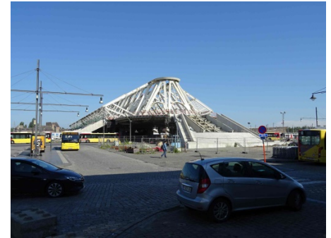
Le chantier de la gare tourne au ralenti.