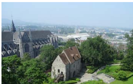
Panorama depuis le beffroi vers la gare, comme une passerelle entre le centre-ville et les Grands-Prés.

Rapidement esquissée, l'évolution des Grands-Prés montre que la gare a historiquement tourné le dos à ce site qui a connu une urbanisation fulgurante ces vingt dernières années. Par ailleurs, les Grands-Prés sont très bien desservis par l'autoroute qui les borde au Nord. Il y a donc un enjeu important de reconnecter physiquement les Grands-Prés au centre historique de la ville, pour créer des synergies et tenter de capter le chaland.