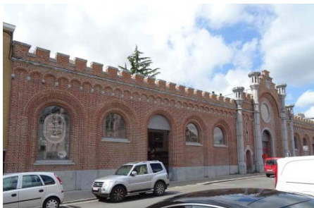
Les Halles du Manège, créées en 2016 et récemment devenues coopératives, connaissent un succès grandissant.