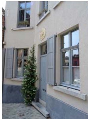
Façade d'une maison rénovée avec soin, dans une ruelle, au pied du beffroi.

Le tissu urbain du centre-ville est également clairsemé de projets de rénovation de maisons unifamiliales, parfois transformées en kot pour étudiants. Très difficile à évaluer, la proportion de maisons unifamiliales est probablement assez importante.