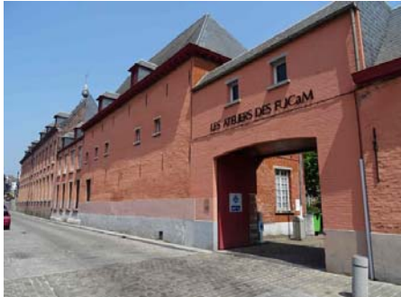
Les ateliers des FUCaM et le centre administratif sont comme un pied-à-terre de l'UCL Mons dans le centre-ville.

En 2011, l'UCL et les FUCaM décident également de fusionner. L'implantation montoise devient l'UCL Mons. L'Université, qui occupe un campus important en périphérie de la ville, a également un pied-à-terre en centre-ville, dont les ateliers des FUCaM.