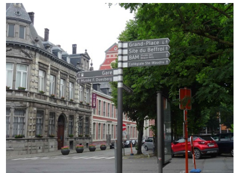
Une signalétique efficace aide le visiteur à rejoindre les points d'intérêt.

Heureusement, une signalétique efficace aide le visiteur à s'orienter dans le dédale de rues médiévales pour rejoindre tous ces lieux de culture, disséminés à travers tout le centre-ville.