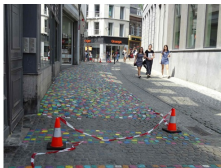
Les pavés colorés à la rue des Fripiers redonne des couleurs à cette partie du piétonnier.