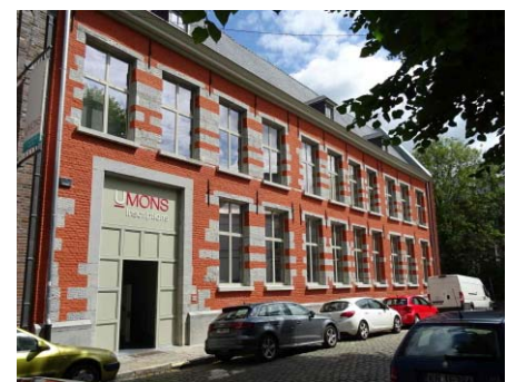
A la place du Parc, les bâtiments de l'UMONS font peau neuve.

Une restructuration aussi importante mène parfois à des relocalisations et déménagements. Ça ne semble pas être le cas à l'UMONS qui confirme son ancrage en centre-ville par une série de projets de rénovation de bâtiments, notamment autour de la place du Parc. La moitié de cette place est actuellement occupée par des bâtiments de l'UMONS, nous fait remarquer le professeur Holoffe. Il y a une volonté de l'université de s'ancrer dans le centre-ville. La réflexion a été la même pour la Faculté d'Architecture et d'Urbanisme, à la rue d'Havré.