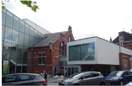
Le théâtre du Manège, une combinaison architecturale audacieuse, un déclencheur de l'aventure culturelle dans le quartier.

Ces travaux ont ouvert la réflexion à la restructuration de tout l'îlot dit Caserne ; cela donnera lieu à la plus importante opération de réalisation de logements au centre-ville de ces dernières années (le projet Corps de ville, Matador, 2014).