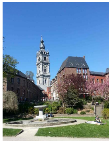
Le beffroi de Mons est entièrement restauré depuis 2015.

Symbole de la ville en rénovation depuis des décennies, le beffroi de Mons a retrouvé tout son éclat en 2015. A l'intérieur, un musée lui est consacré et met en valeur l'unique beffroi baroque de Belgique, classé au patrimoine mondial de l'UNESCO.