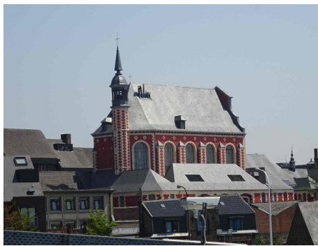
L'Artothèque, un nouveau marqueur du paysage depuis les quais de la gare.

En arrivant à Mons, sur le quai de la gare, outre le chantier de celle-ci et le beffroi qui domine fièrement la ville, un nouveau repère attire l'attention. C'est une chapelle, fraîchement rénovée et repeinte d'une couleur traditionnelle en rouge vif. L'ancien couvent des Ursulines est devenu la nouvelle artothèque et abrite les œuvres artistiques de la ville, suivant des procédés de classement modernes. Inaugurée en 2015, ce nouvel outil, conçu par l'atelier Gigogne et AM L'Escaut Architecture, montre à quel point la ville a fondamentalement restructuré son environnement culturel et artistique, et a réorganisé ses collections et ses archives.