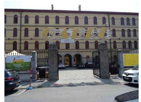
Le Carré des Arts accueille l'école supérieure des Arts et le siège de la télévision locale TéléMB.