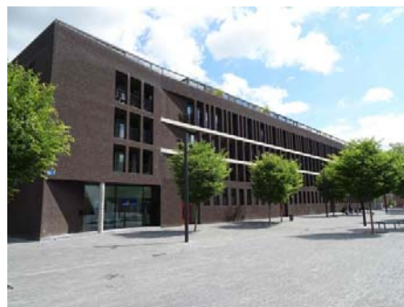
Corps de Ville, un projet de 106 logements, réalisé par le bureau Matador dans le cadre d'une opération de rénovation urbaine.

Aujourd'hui, les opérations d'envergure de réalisation de logements comptent quelques dizaines de logements, essentiellement des appartements. La dernière grande réalisation a été menée dans le cadre d'une revitalisation urbaine de l'îlot Caserne, au cœur du « kilomètre culturel », évoqué plus haut. Un ensemble de 106 logements de qualité, réalisé par le bureau Matador y a pris place et complète judicieusement la restructuration de l'îlot, occupé notamment par le théâtre du Manège, le palais de Justice et des services administratifs.