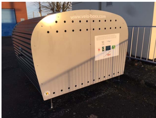
Figure 1 © Bernissart

Plus d'info : Nicolas Rochet, 071/300.300, nrochet@espace-environnement.be