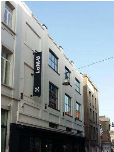
En quelques mois, la Manufacture Urbaine s'est intégré dans le paysage Horeca de la Ville Basse, en investissant l'ancienne médiathèque.

La mobilité est un thème qui a accompagné le développement des projets récents et sera vraisemblablement aussi important dans les années à venir. Outre la finalisation de la boucle du métro, ce qui a été fait porte globalement sur les qualités des espaces publics en rendant notamment les places publiques aux piétons (ex. : la place de la Digue, la place Verte, les quais...). Les nouvelles dispositions relatives au stationnement, qui devient payant dans l'ensemble de l'intra-ring, visent également à diminuer la pression exercée par les voitures, dans le centre-ville.