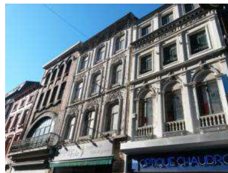
Les étages des commerces sont souvent inoccupés.

Car c'est là un enjeu fondamental pour la ville, qui s'est vidée durant des décennies de ces habitants. « Faire revenir les familles en ville. On a fait le commercial, les services, la culture... il reste à faire revenir les habitants (SC). »