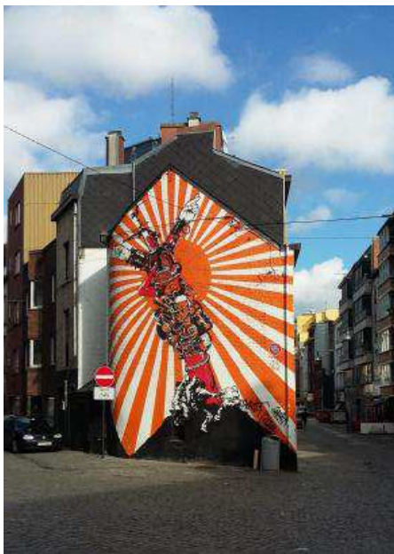
Place Rucloux, un mur aveugle après l'intervention de « Couleurs Carolo », un des 7 sites investis pendant l'été 2011.