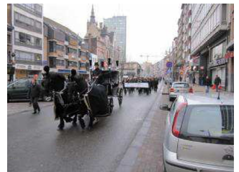
Le 8 février 2010, symboliquement, des commerçants de la Ville Basse organisent un cortège funèbre en direction de l'Hôtel de Ville.

Une descente aux enfers qui semble ne jamais s'arrêter... Voilà le sentiment partagé par les Carolos au lendemain du séisme politique qui s'est joué au milieu des années 2000 à Charleroi. Ebranlé, le système politique se remet lentement en état de marche, mais la décrépitude de la ville n'attend pas. Le centre-ville se dégrade à vue d'œil. Les commerces ferment les uns après les autres... « Le dernier qui s'en va éteint la lampe ! » nous disait un observateur au plus fort de la crise commerciale qui a fini par emporter le Centre Électronique (2013), une enseigne historique du boulevard Tirou.