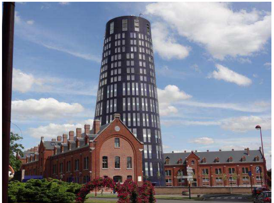
L'Hôtel de Police, œuvre de Jean Nouvel, est une tour de diamètre ovoïdale ceinturée d'anciennes casernes rénovées.

Bien d'autres grands projets ont été réalisés sur cette période et sur le périmètre du centre-ville, renforçant sa vocation de centralité. Citons-en deux, qui marquent à leur manière le paysage carolo, l'Hôtel de Police à la Ville Haute, une singulière tour bleue réalisée par une équipe d'architectes emmenée par Jean Nouvel, et, toujours dans le cadre du portefeuille Phénix à la Ville Basse, le Quai 10, nouveau pôle culturel dédié à l'image (cinéma et gaming).