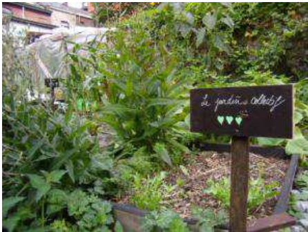
Le Jardin du Parc, en plein centre-ville, est une friche urbaine investie et transformée en jardin partagé par des citoyens.

« J'ai rencontré des gens actifs, de tous horizons, nous dit-elle, qui ont envie de créer du bien-être. » C'est donc avant tout un projet social et solidaire. « Le jardin du Parc, c'est une découverte de la vie citoyenne. On s'approprie les lieux personnellement. C'est un projet autonome où on se base sur l'action et la solidarité des gens. Il y a du lien social qui se crée et c'est par l'action que ça se fait. On s'organise au fur et à mesure. Il faut entretenir et donc il faut que l'équipe qui s'engage dans le projet s'implique pour qu'il vive. Mais avant tout, c'est le plaisir d'être ensemble dans un coin de verdure un peu atypique en centre-ville. »