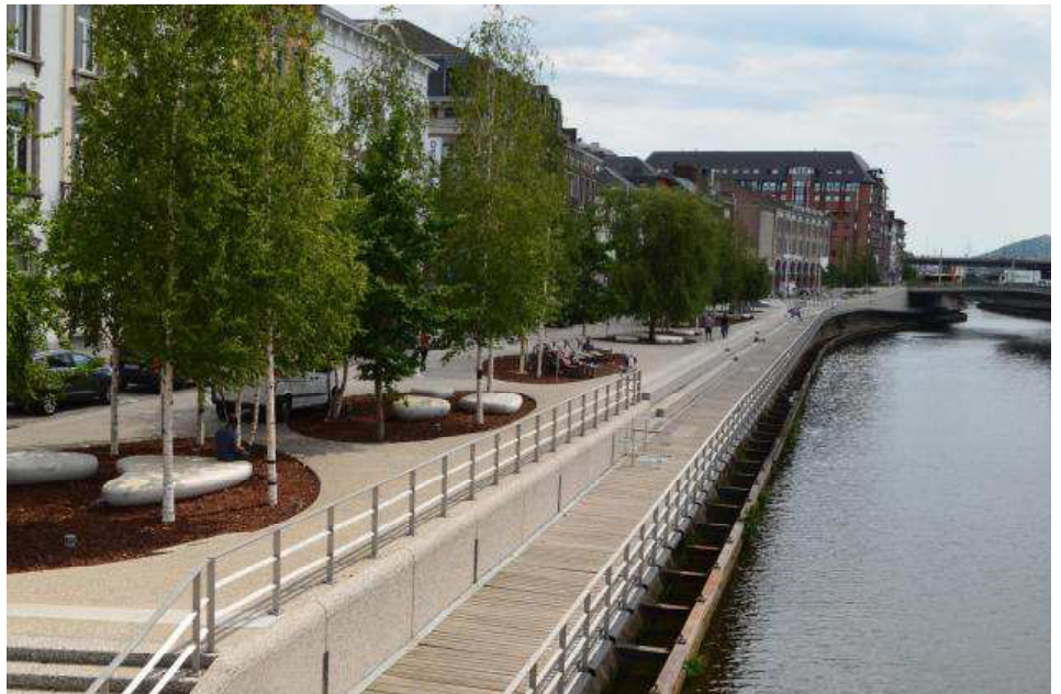
Le réaménagement des quais de Sambre consacre un lieu de convivialité et de réappropriation de la rivière.

A l'initiative de la Ville de Charleroi et de l'Igretec, un salon de l'immobilier est créé il y a trois ans. L'objectif est de proposer, une fois par an, un lieu de rencontres et d'échanges aux promoteurs, porteurs de projets (publics ou privés) et pouvoirs locaux et d'y présenter les potentialités et les opportunités de développement et de booster les partenariats.