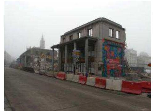
Les démolitions sont importantes et emportent avec elles certains éléments du patrimoine carolo, comme le « Cabaret Vert », lieu d'escale de Rimbaud (à gauche) et les « Colonnades » construites par J. André (à droite).

Les réactions ne se font pas attendre. La Ville de Charleroi planche sur une opération de rénovation urbaine à la Ville Basse et un projet en cofinancement européen de rénovation des espaces publics, avec un portefeuille d'actions, appelé Phénix.