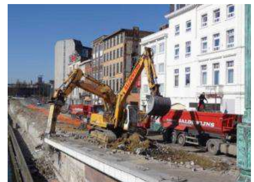
Réaménagement de la place de la Digue, de la rue de la Montagne et des quais.