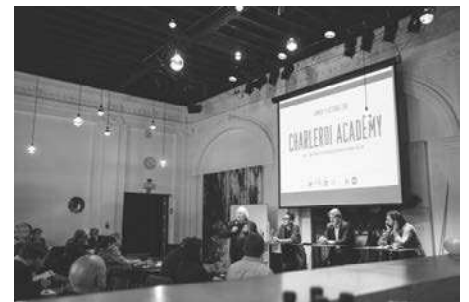
La Charleroi Academy organise des sessions d'ateliers thématiques ouverts au public, favorisant le débat sur la ville.