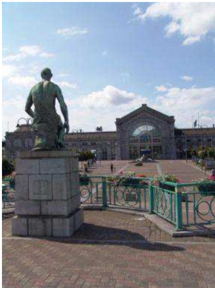
La gare de Charleroi, véritable nœud d'intermodalité, a connu et connaîtra encore d'importants travaux d'aménagement de ses abords... au bénéfice de ses usagers.

Par le biais des chantiers, en ville et sur le ring, l'accessibilité du centre-ville en voiture devient également très problématique, et montre les limites d'un développement centré sur la voiture. La valorisation des autres modes de déplacement, transports en commun et modes actifs (marche et vélo), sera une dimension essentielle à prendre en compte dans tout nouveau développement.