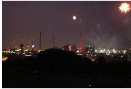
Le 31 Mai 2008, le festival Mai'Tallurgie se termine en apothéose par un spectacle Son et Lumière , au beau milieu du site sidérurgique.

Cette expérience a également mis en lumière l'incroyable énergie citoyenne et l'attachement des Carolos à leur ville. Ce n'est pourtant pas nouveau ; depuis de nombreuses années, par exemple, à la Porte Ouest (Marchienne), une série de partenaires publics, associatifs et