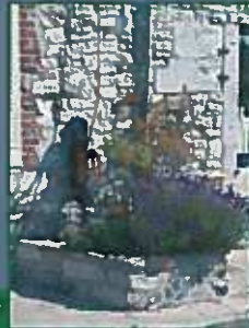
La pierre locale