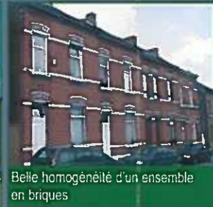
Belle homogénéité d'un ensemble en briques