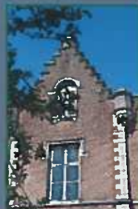
Point de repère, l'ancienne Maison communale