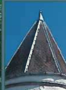
Silhouette familière d'une toiture, le « petit patrimoine » des façades