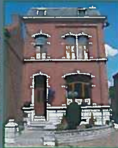
Maison « 1900 »