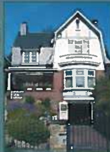
Villa « années 30 »