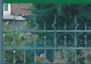
Volutes de fer d'une clôture