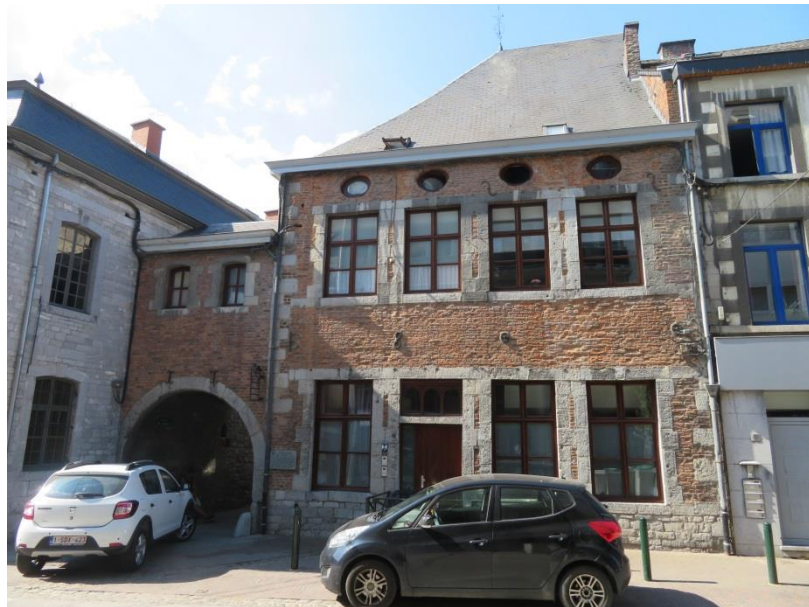
Le vieux Marche

Les nombreuses rénovations de bâtiments menées grâce aux partenariats entre les opérateurs publics ont montré l'exemple au secteur privé qui a investi parallèlement. Comme le centre-ville est couvert par une zone protégée en matière d'urbanisme, le principe a été de conserver au maximum l'aspect ancien tout en l'adaptant à la réalité actuelle.