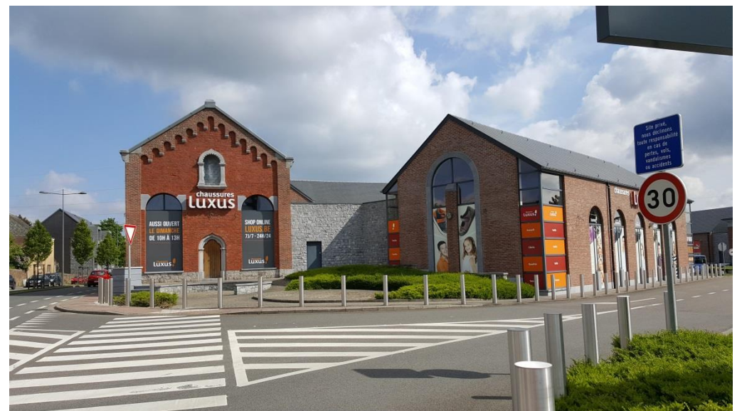
Rénovation du Carmel en commerce