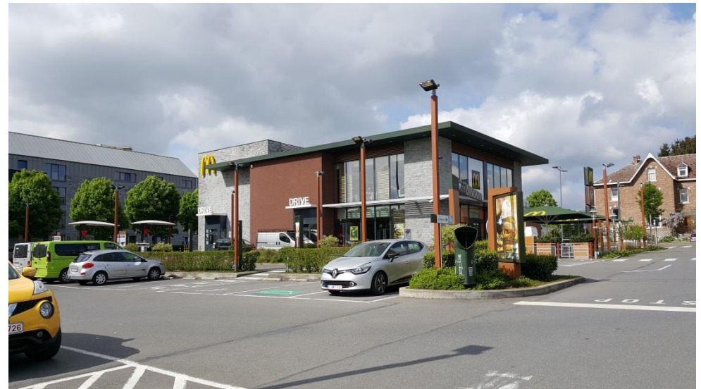
Intégration d'un nouveau bâtiment commercial - ©Espace Environnement