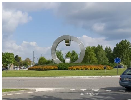
Intégration d'une sculpture et de mobilier urbain