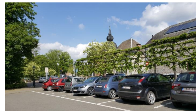
Exemple de poche de stationnement dans le centre