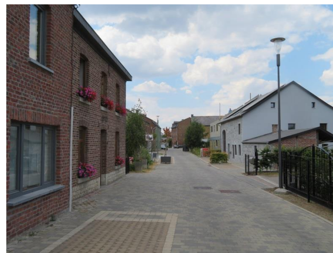
Melreux – Rue du Chapelet