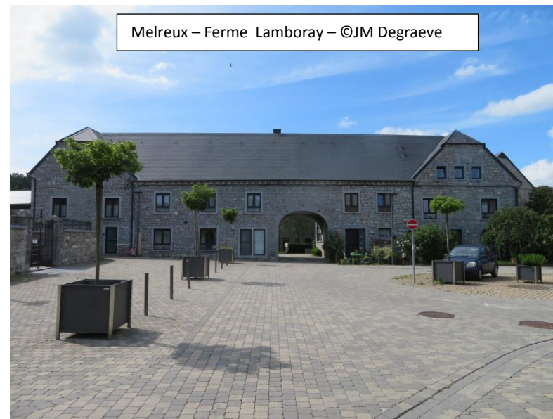
Melreux – Ferme Lamboray

Couplée à la rénovation des espaces publics autour de l'église classée, cette opération forme un ensemble architectural de grande qualité. Ce réaménagement de l'espace public a été complété par la rénovation globale de la rue du Chapelet selon la « recette hottonaise » de partenariat entre la commune et les riverains