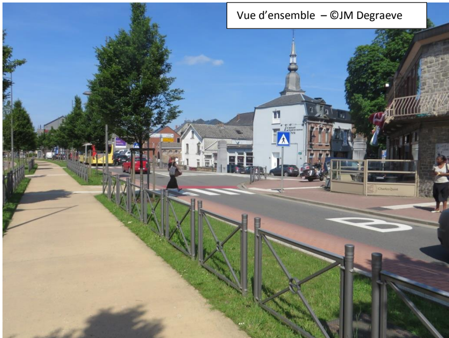
Vue d'ensemble