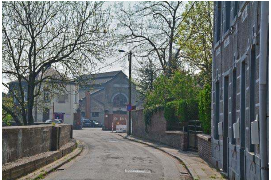
Rue de l'Abattoir

L'ancien abattoir est actuellement occupé par une série d'associations qui font revivre le site et participent à la vie du quartier.