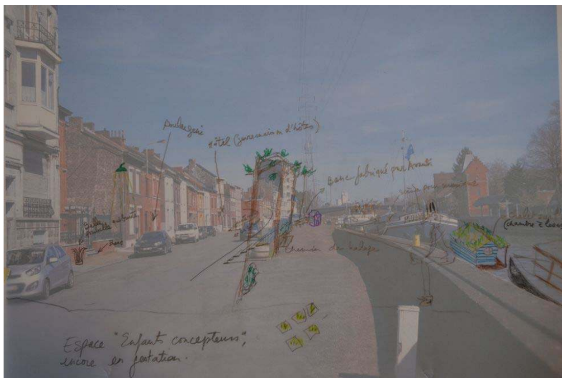
La proposition du groupe « Quai de Sambre »