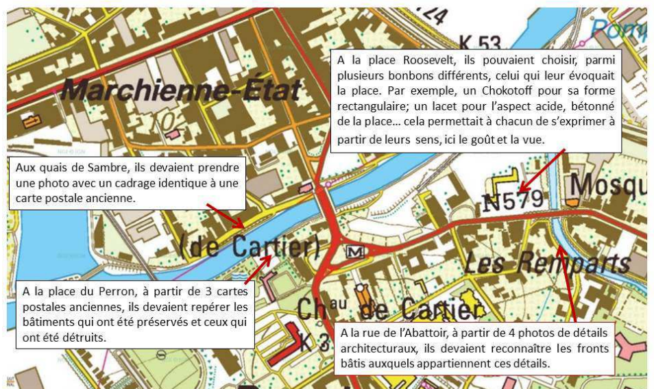
Extrait de la carte topographique, éd. 1993

Ces exposés peuvent être visionnés sur le site internet du projet : http://maitallurgie.be/2018/retour-sur-les-rencontres-pre-maitallurgiques/ .