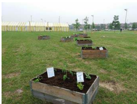
Le site Boch à La Louvière est en pleine effervescence

Accompagnés par la commune, ces projets permettent de redonner vie à des espaces en friches, ici en plein centre-ville, et de redynamiser le quartier en attendant les développements de projets à venir.