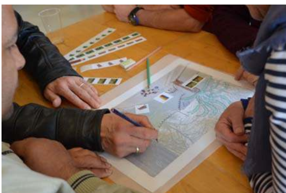
Les habitants redessinent leur quartier.

Il a joué un rôle stratégique dans le développement de Marchienne, pour le transport de marchandises et de productions industrielles.