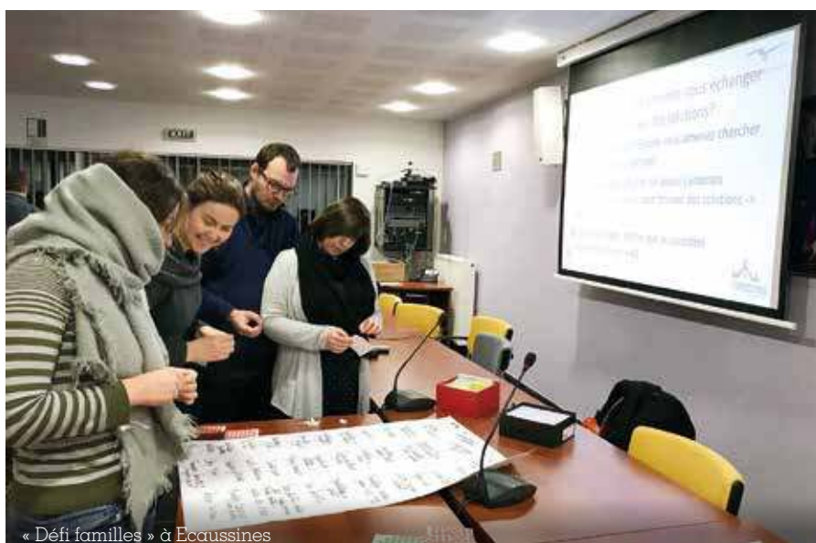
« Défi familles » à Ecaussines