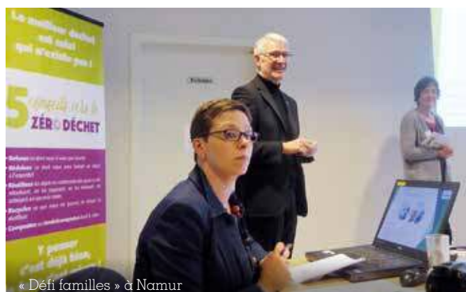
« Défi familles » à Namur