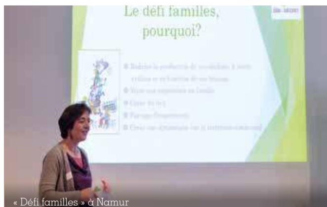
« Défi familles » à Namur

modes de consommation responsables en prenant appui sur l'accompagnement d'un nombre restreint de ménages. Ceux-ci se fixent un objectif de réduction de leur production de déchets et avancent pas à pas, grâce à l'organisation d'ateliers pratiques sur des thèmes variés : comment démarrer un compost ? Comment mettre en place un potager ? Comment fabriquer soi-même ses produits d'entretien ? Comment s'équiper pour acheter en vrac ? Etc. Gesves, Sainte-Ode, Namur, Ecaussines, Braives, Waremme, Pont-à-Celles ont toutes récemment lancé leur Défi Familles, avec la collaboration de foyers