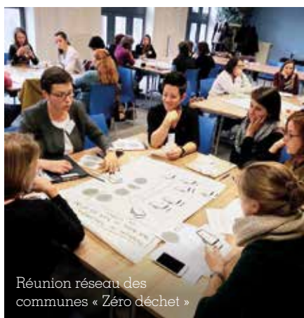
Réunion réseau des communes « Zéro déchet »