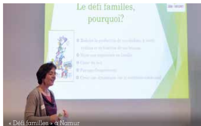
« Défi familles » à Namur

modes de consommation responsables en prenant appui sur l'accompagnement d'un nombre restreint de ménages. Ceux-ci se fixent un objectif de réduction de leur production de déchets et avancent pas à pas, grâce à l'organisation d'ateliers pratiques sur des thèmes variés: comment démarrer un compost? Comment mettre en place un potager? Comment fabriquer soi-même ses produits d'entretien? Comment s'équiper pour acheter en vrac? Etc. Gesves, Sainte-Ode, Namur, Ecaussines, Braives, Waremme, Pont-à-Celles ont toutes récemment lancé leur Défi Familles, avec la collaboration de foyers