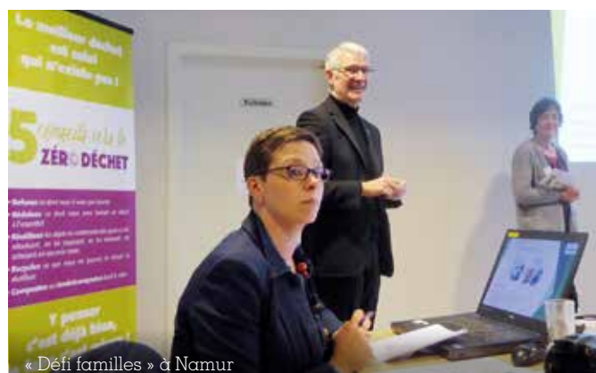
« Défi familles » à Namur