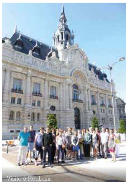
Visite à Roubaix

Une dynamique de réseau vient ensuite compléter ce processus d'accompagnement individuel des 10 communes lauréates. Elle se matérialise à travers des visites de terrain (en juin 2017, par exemple, un déplacement à Roubaix, l'une des premières villes labellisées « Zéro Déchet Zéro Gaspillage » en France, a été réalisé), des rencontres régulières d'échanges de pratiques et l'animation d'une communauté « Communes Zéro Déchet » sur les réseaux sociaux (Facebook et Twitter).