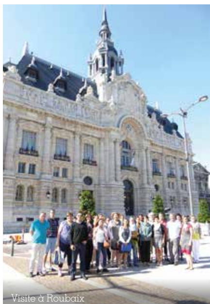
Visite à Roubaix

Une dynamique de réseau vient ensuite compléter ce processus d'accompagnement individuel des 10 communes lauréates. Elle se matérialise à travers des visites de terrain (en juin 2017, par exemple, un déplacement à Roubaix, l'une des premières villes labellisées « Zéro Déchet Zéro Gaspillage » en France, a été réalisé), des rencontres régulières d'échanges de pratiques et l'animation d'une communauté « Communes Zéro Déchet » sur les réseaux sociaux (Facebook et Twitter).