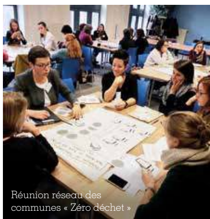
Réunion réseau des communes « Zéro déchet »