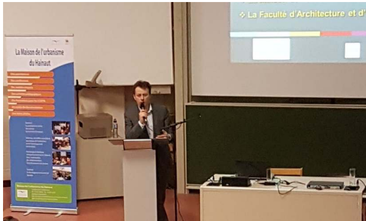
Conférence du Ministre Carlo Di Antonio, le 17 mars 2017 à Mons.

Extrait du dépliant de présentation des activités de la MU.