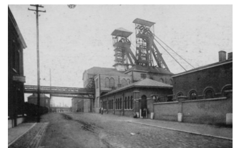
Un ancien site minier ( www.quartierdumartinet.be )

Avec le temps, le terrain étant au repos, la nature a progressivement colonisé le territoire. Le site offre un habitat naturel très spécifique, notamment sur ses terrils, ce qui lui donne un haut potentiel de qualité écologique.