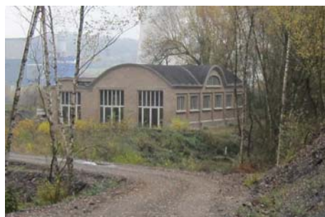
Le site pourrait accueillir un centre d'interprétation de la nature (ci-dessus la remise à locomotives)

l'aspect humain du projet et doit contribuer à donner une vie sociale sur le site.