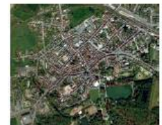
Vue aérienne d'un centre-ville (Enghien)

Pour protéger cette identité et l'image cohérente des villes wallonnes traditionnelles, une réglementation a été mise en place : Le « Règlement Général sur les Bâtieses en Zones Protégées en matière d'Urbanisme (R.G.B.Z.P.U.) ». Il vise à sauvegarder les centres urbains de qualité. On dénombre 68 centres anciens wallons actuellement concernés par ce règlement. On appelle ces centres anciens protégés des Zones Protégées en matière d'Urbanisme. Un périmètre est défini pour chaque centre et correspond au cœur historique et à la zone urbaine la plus densément bâtie.