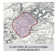
Le périmètre de la zone protégée