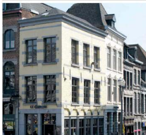
Ensemble bâti de qualité