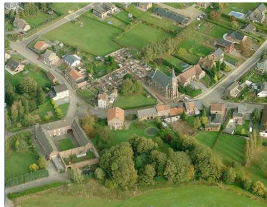
Structure de tissu de centre de village - Source : CPDT

L'intérêt de l'étude, au-delà de cette caractérisation des tissus, réside dans des propositions de leur transformation lors de projet de densification, transformation visant une amélioration des conditions de vie des habitants ; le projet de densification orienté de la sorte devenant alors un plus pour le quartier ou la commune.