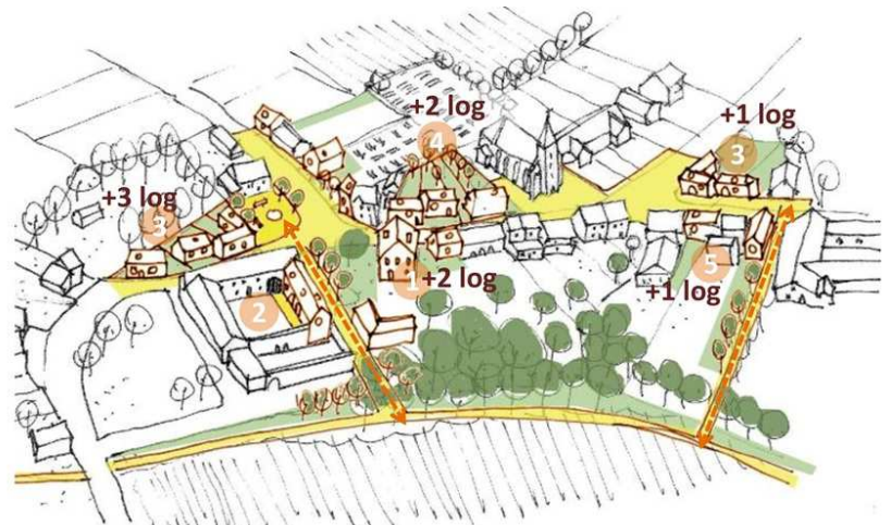
Proposition de densification du tissu de centre de village