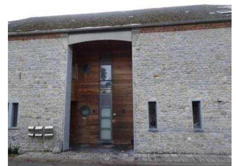
Bâtiment agricole réaffecté à Beaumont

En milieu rural, la réaffectation de bâtiments agricoles inoccupés peut aussi soutenir la densification.